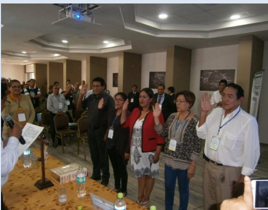
ELECCIÓN DEL COMITÉ DE VIGILANCIA