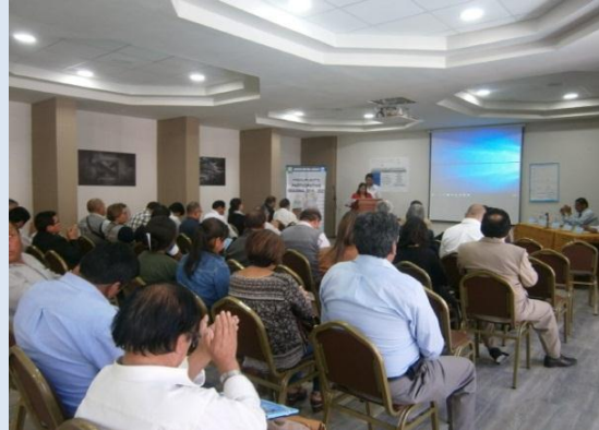
CAPACITACIÓN A LOS AGENTES PARTICIPANTES